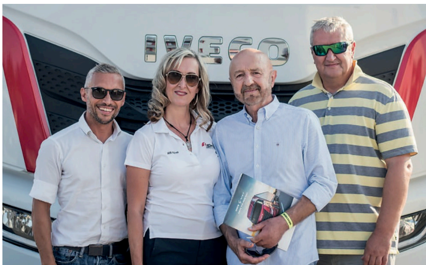
Se zástupcem firmy IVECO během letního Šmídlování, 2019.